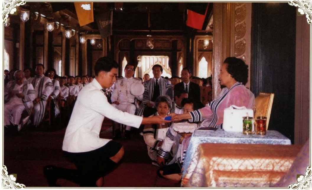
๒๙ ธันวาคม ๒๕๓๗ พระบาทสมเด็จพระเจ้าอยู่หัว ทรงพระกรุณาโปรดเกล้าโปรดกระหม่อมให้เสด็จแทนพระองค์ไปพระราชทานประกาศนียบัตรและรางวัลแก่นักเรียนวชิราวุธวิทยาลัย ณ หอประชุมวชิราวุธวิทยาลัย 29 December 1994 Her Royal Highness Princess Bejaratana, by Royal Command, represented His Majesty the King in presenting Certificates and Awards to students of Vajiravudh College, at the Conference Hall, Vajiravudh College.