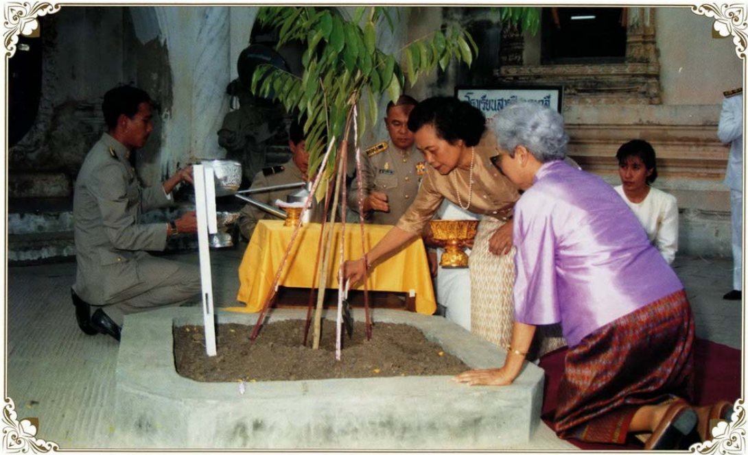
๒๐ กุมภาพันธ์ ๒๕๓๒ ทรงปลูกต้นไม้ในโอกาสเสด็จไปทรงบำเพ็ญพระกุศลมาฆบูชา ณ วัดพระปฐมเจดีย์ราชวรมหาวิหาร จังหวัดนครปฐม

พระองค์ทรงมีพระจริยวัตรงดงาม ทรงเปี่ยมด้วยพระเมตตา ทรงรักาศิล ๕ ได้อย่างบริสุทธิ์ และที่สำคัญยิ่ง ทรงมีพระกตัญญูต่อสมเด็จพระบรมชนกนาถและพระชนนีเป็นอย่างยิ่ง จะทรงตั้งเครื่องสังเวทพระกระยาหารกลางวันทุกเวลากลางวัน และทรงจัดดอกไม้จตุรปูเทียนบุชา พระบรมทนต์และพระบรมอัฐิสมเด็จพระบรมชนกนาถและพระชนนีทุกเวลาค่ำ