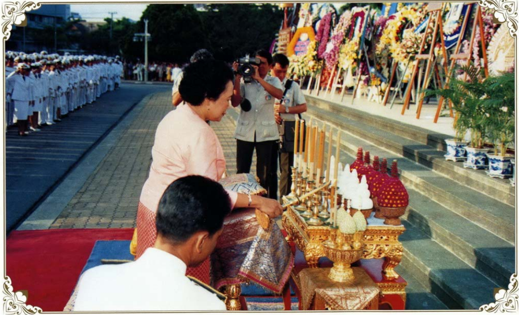
๒๕ พฤศจิกายน ๒๕๒๙ พระบาทสมเด็จพระเจ้าอยู่หัว ทรงพระกรุณาโปรดเกล้าโปรดกระหม่อมให้เสด็จแทนพระองค์ไปทรงวางพวงมาลาถวายบังคมพระบรมราชานุสรณ์พระบาทสมเด็จพระมงกุฎเกล้าเจ้าอยู่หัว ณ สวนลุมพินี กรุงเทพมหานคร 25 November 1986 Her Royal Highness Princess Pejaratana, by Royal Command, represented His Majesty the King in presiding over the Wreath Laying Ceremony at the Royal Statue of King Rama VI, Lumpini Park, Bangkok.