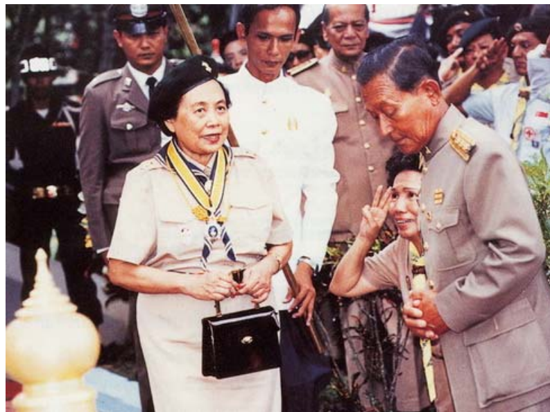
สมเด็จพระเจ้าภคินีเธอ เจ้าฟ้าเพชรรัตนราชสุดา สิริโสภาพัณณวดี องค์อุปถัมภ์ภิกาคณะลูกเสือแห่งชาติ ทรงประดับเครื่องราชอิสริยาภรณ์อันมีสิริยิ่งรามเกียรติ์ ลูกเสือสดุดีชั้นพิเศษ

ที่มา: http://3.bp.blogspot.com/-HqFydFekoWc/TJQ1uauDAHI/AAAAAAAIIDg/urdCtQotz8Q/s1600/HRHPrincessBejaratana_Page_4_resize.jpg