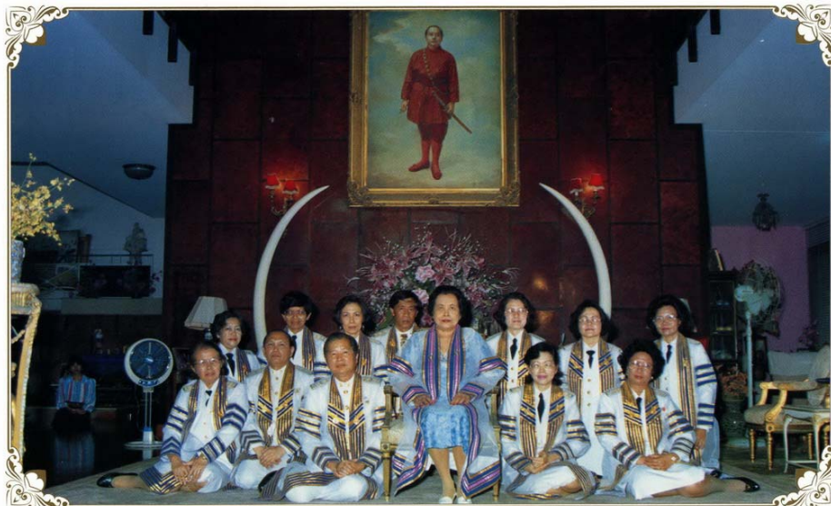
๑๐ กรกฎาคม ๒๕๓๔ ทรงฉายในโอกาสพระราชทานพระวโรกาสให้สภาสถาบันเทคโนโลยีราชมงคลเฝ้า ถวายปริญญาคุณกรรม ศาสตรบัณฑิตกิตติมศักดิ์ ทางพัฒนาการครอบครัวและเด็ก ณ วังรินฤดี

พ.ศ. ๒๕๓๔ สถาบันเทคโนโลยีราชมงคล ถวายปริญญาคุณกรรมบัณฑิตกิตติมศักดิ์สาขาพัฒนาการ ครอบครัวและเด็ก โดยที่ทรงบำเพ็ญพระกรณียกิจในด้านการส่งเสริมความสุขของเด็ก และพัฒนาการครอบครัว อย่างเด่นชัด อันได้แก่ การที่ทรงอุปถัมภ์กิจการเนตรนารี อนุภาชาต อาสาภาชาต และทรงส่งเสริมการศึกษาใน สถาบันต่างๆ