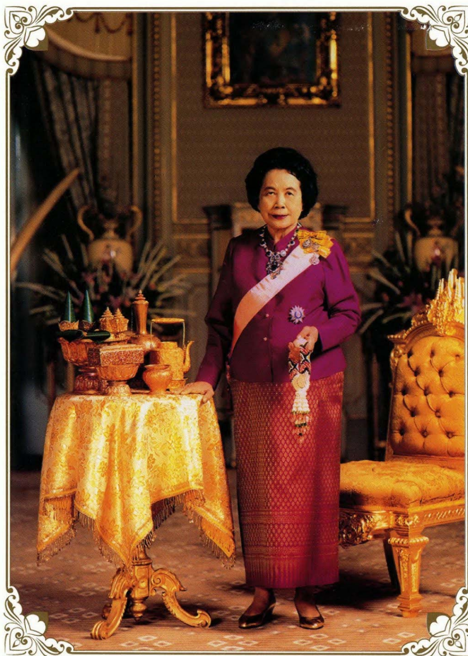
สมเด็จพระเจ้าภคินีเธอ เจ้าฟ้าเพชรรัตนราชสุดา สิริโสภาพัฒนาวดี Her Royal Highness Princess Bejaratana