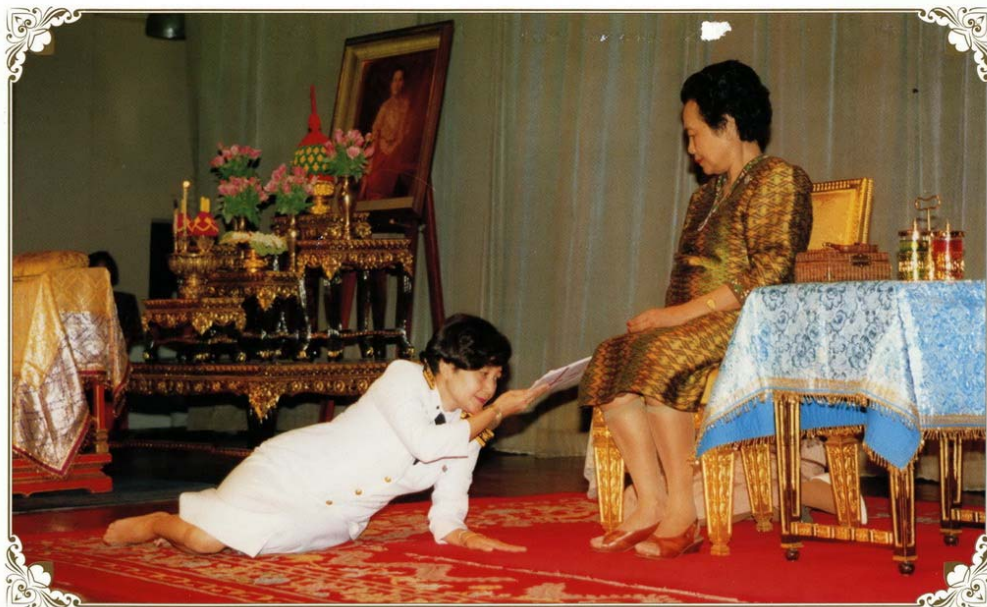
๑๗ มิถุนายน ๒๕๓๕ พระราชทานทุนสมเด็จพระศรีพัชรินทราบรมราชินีนาถ แก่ผู้แทนโรงเรียนมัธยมศึกษาและวิทยาลัยพยาบาล ทั่วประเทศ 17 June 1992 Her Royal Highness Princess Bejaratana presenting Her Majesty Queen Sri Bajarintra' s scholarships to representatives of various Secondary Schools for Girls and Nursing Colleges.